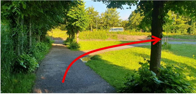
Houdt rechts aan