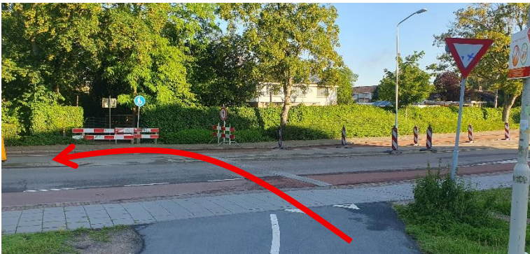
Steek voorzichtig de Banneweg over