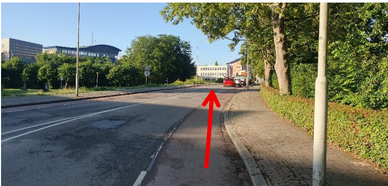
Fiets over de Banneweg naar de spoorwegovergang